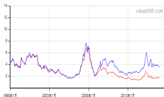
(本周沪深两市平均市净率)