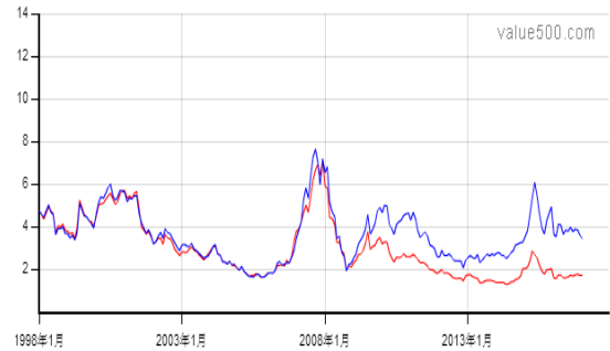
(本周沪深两市平均市净率)