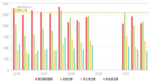
每日沪港通额度变化图

总体看，市场题材活跃，对中美贸易摩擦有免疫力的题材有望与利空切割，走出独立结构性行情，值得战略关注！风险角度，建议警惕年报、季报业绩风险和个股解禁风险。