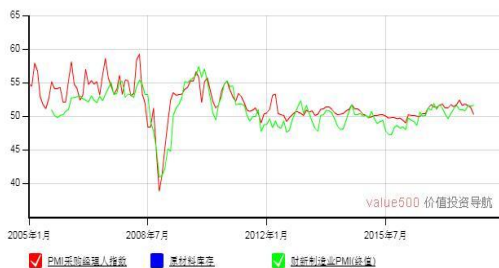
中国 PMI 走势图