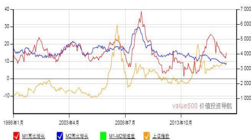
M1-M2 增速差与上证综合指数走势图

有 28 吨制冷剂产能。金石资源是国内萤石龙头公司，将受益于氢氟酸及制冷剂价格的上涨。