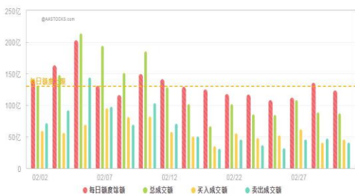
每日沪港通额度变化图

3. 根据七彩云电商最新消息，分散染料龙头企业3月1日起将大幅上调分散染料价格，其中代表性品种分散黑ECT300%出厂价从4.5万元/吨上调至5万元/吨。这是今年以来的第二次提价，上一次提价是2月1日，分散黑ECT300%价格从4万元/吨提到4.5万元/吨。与去年同期价格2.8万元/吨相比，最新价格同比上涨近80%。