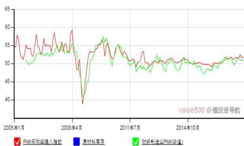
中国 PMI 走势图