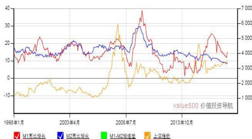
M1-M2 增速差与上证综合指数走势图

能不低于 200MWp，多晶硅电池和单晶硅电池最低光电转换效率分别不低于 19%和 21%等条件。