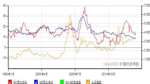
M1-M2 增速差与上证综合指数走势图

4. 电竞 | 在第二届世界电竞运动会 (WESG) 全球总决赛进行之际, 运营该赛事的阿里体育与海外手游“虚荣”今天宣布正式结盟, 从而使得第三届 WESG 的正式比赛项目将增加到 5 项, 分别为 CS:GO、GOTA2、星际争霸、炉石传说和虚荣, 这也是 WESG 首次纳入了手游项目, 此前四个正式比赛项目均为 PC 端项目。