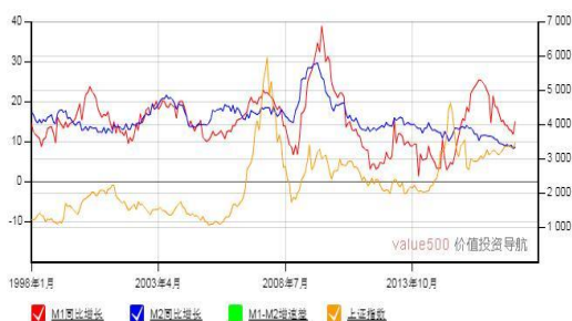
M1-M2 增速差与上证综合指数走势图