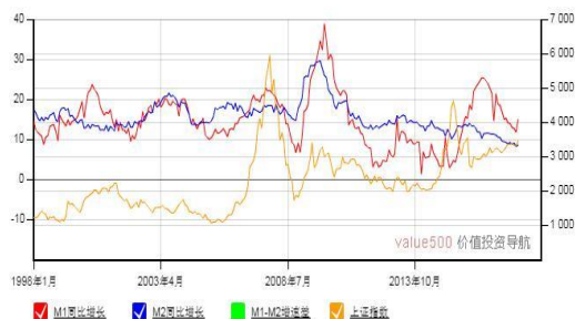
M1-M2 增速差与上证综合指数走势图

点评: 公司方面, 任子行持有上海创稷投资中心(有限合伙) 2.378% 的股份。根据 2017 年 6 月底的合伙人报告, 上海创稷投资中心(有限合伙) 持有北京京东金融科技控股有限公司 0.58% 的股份。法尔胜在互动平台表示, 间接持有京东金融约 0.21% 的股权。7. 欧美股市 | 美三大股指大幅收涨近 2%, 扎克伯格相信 Facebook 会处理好风险。