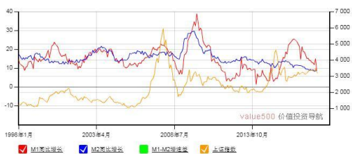
M1-M2 增速差与上证综合指数走势图

4. 军工 | 在中美贸易战的大背景下，此次美国对中兴通讯的禁售处罚，必引起国内对长期依赖进口的关键元器件、零部件、新材料的警觉，尤其在军用领域，我国目前还有大量关键零部件和材料采用进口产品，长期对国防安全造成隐患。机构认为，贸易战背景下，军工行业的国产替代及自主可控主要体现在两个维度，军工信息化及大飞机产业。