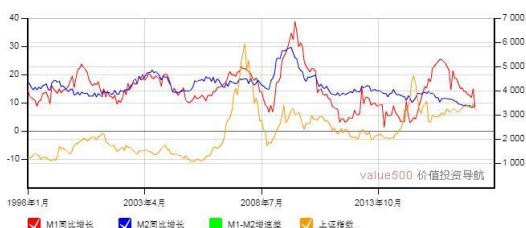
M1-M2 增速差与上证综合指数走势图