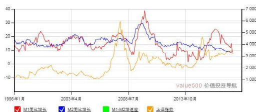
M1-M2 增速差与上证综合指数走势图

4. 中俄地方合作园 | 首个中俄地方合作园在青岛正式启航。随着中俄全面战略合作伙伴关系的发展，在我国“一带一路”倡议的推动下，中俄地方交流活动不断深入开展，取得了一系列成果。