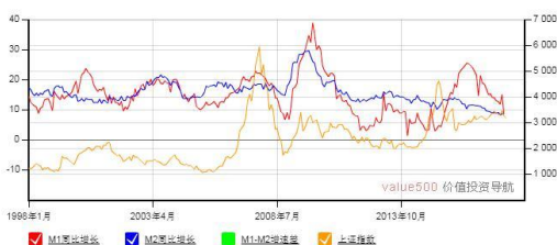
M1-M2 增速差与上证综合指数走势图

4. 核电 | 国家国防科技工业局副局长王毅初在中国核能可持续发展论坛上表示，“目前核燃料产业园方案已经编制完成。”今后我国将优化核燃料产业布局，在核电相对集中的东南沿海地区建立具有国民竞争力的核燃料产业园，为核电发展提供一站式服务，将加强工业用各类放射源及相关产品的研发、制造、经营与技术服务，并逐渐形成规模化的发展，大力提升核技术在材料、核放射仪器仪表等产品市场份额。