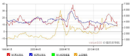
M1-M2 增速差与上证综合指数走势图

4. 物联网 | 工业和信息化部信息通信发展司司长闻库表示，目前全国全网近 40 万个 NB-IoT 的基站的建设逐步实现了全国范围内的广泛覆盖。今年看，三家基础电信运营企业有望再增加 30 万个基站。下一步将进一步优化推动 NB-IoT 的网络覆盖，推动 NB-IoT 窄带物联网向更多领域发展，形成规模效应，促进成本降低，推动 NB-IoT 产业的繁荣发展。