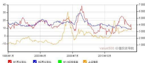
M1-M2 增速差与上证综合指数走势图