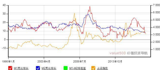
M1-M2 增速差与上证综合指数走势图

点评：伟明环保（603568）拥有国际先进、国内领先的自主知识产权垃圾焚烧炉排炉及烟气净化技术。博世科（300422）围绕水治理为核心，同时开展土壤修复、固废、环评等各项业务。